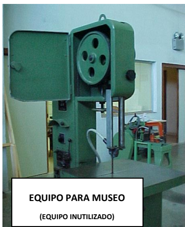
EQUIPO PARA MUSEO (EQUIPO INUTILIZADO)

Las máquinas antiguas, sobre todo las de fabricación anterior al 1 de enero de 1995, en las que no se haya podido proteger las partes peligrosas de la máquina para su uso, se desecharán o se guardarán si se quiere para museo o docencia (visualización del equipo), pero con todas las partes peligrosas protegidas para evitar el acceso a ellas y con las conexiones eléctricas, etc. eliminadas, de manera que nunca se puedan volver a usar. Se colocará un cartel de “equipo para museo (equipo inutilizado)” y se guardará así hasta que vaya a formar parte de la exposición allí donde se decida colocar.