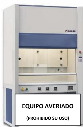
EQUIPO AVERIADO (PROHIBIDO SU USO)