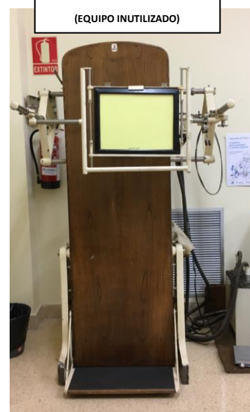
EQUIPO PARA MUSEO (EQUIPO INUTILIZADO)

Nota: puede consultar toda la información al respecto al mantenimiento de máquinas o equipos de trabajo en el procedimiento PO-PRL-GC-05 aprobado por el Comité de Seguridad y Salud el 10 de septiembre de 2020.