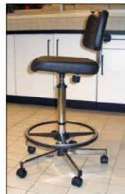
Figura 2. Silla para trabajo en altura.