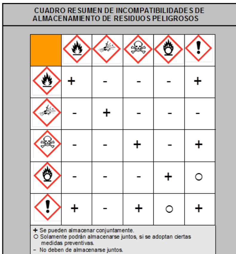
Figura 1. Incompatibilidades de almacenamiento de algunos productos químicos peligrosos.

Cuando se tienen productos químicos con riesgos múltiples, habrá que hacer una estimación de la severidad del riesgo, teniendo en cuenta las cantidades totales almacenadas, el material y el tamaño del recipiente. Un criterio para establecer la severidad del riesgo (de mayor a menor) sería: 1º explosivos, 2º comburentes, 3º inflamables, 4º tóxicos, 5º corrosivos y 6º nocivos.