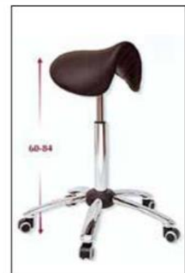
Figura 3. Taburete para tareas con movilidad.